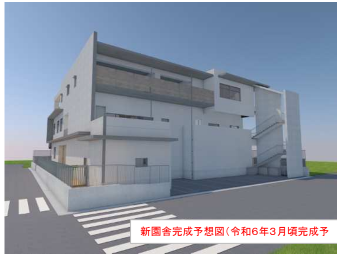
新園舎完成予想図(令和6年3月頃完成予)