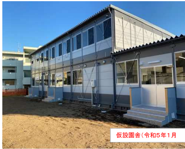
仮設園舎(令和5年1月)