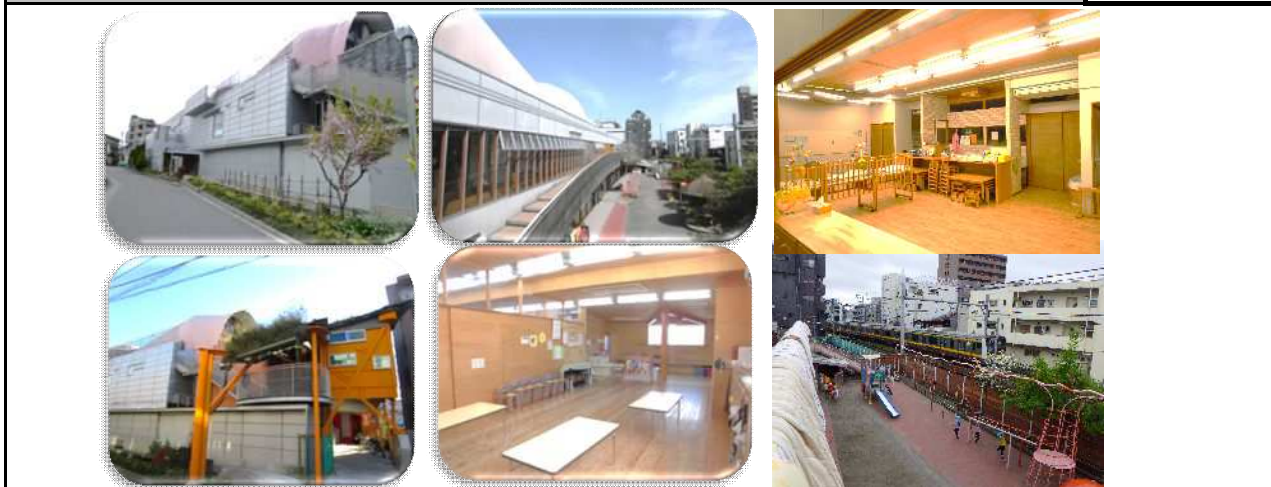
施設の運営方針、保育の特徴