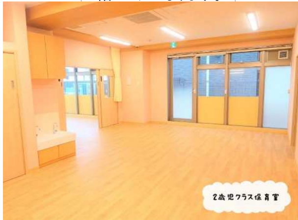
2歳児クラス保育室