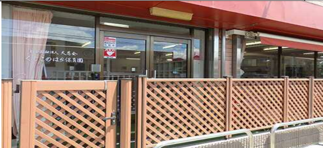
施設の運営方針、保育の特徴