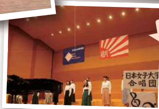
日本女子大学 日本女子大学合唱団