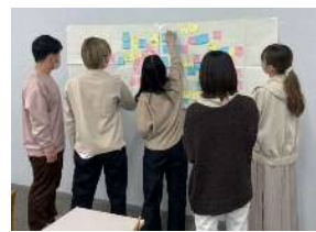
ワークショッププログラムの開発風景