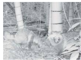
キャンパス内のタヌキ

子どもから大人まで楽しめる内容で生態系を学び、自分が暮らす街の自然を見つめなおすきっかけになった講座でした。