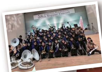
専修大学 専修大学吹奏楽研究会