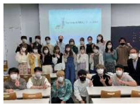
共生社会理解のために「SDGs de 地方創生」に参加

鈴木ゼミナールは、令和3年度に大日本印刷株式会社(以下、DNP)と連携活動をしています。連携活動では、ダイバーシティとインクルージョンを推進し共生社会を実現するため、DNPソーシャルアクションサービス「May ii(メイアイ)」の認知度向上・利用促進に向けた学生目線での提案と、共生社会を理解するためのワークショッププログラムの開発を進めています。