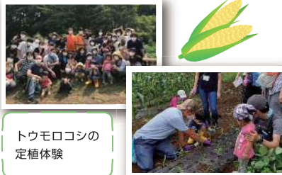
トウモロコシの 定植体験