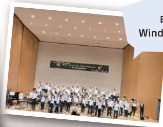
明治大学 Wind Orchestra