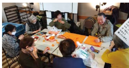
ロバくんの手芸をしている様子