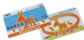
認知症サポーターカード

養成講座で認知症について理解し、誰もが思いやりをもって安心して暮らせるまちを一緒に作りませんか。町内会・自治会や老人会、ボランティア団体、企業などで養成講座を実施しています。お気軽にご相談ください。