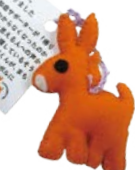
ロバくんのストラップ

オレンジ色の「ロバ隊長(ロバくん)」は、「認知症サポーターキャラバン」のマスコットキャラクターです。私たちはこの「ロバくん」を広く配布して、街中を歩く認知症の人にとっての安心のシンボルにしたいと考え、ぬいぐるみのストラップづくりを始めました。認知症家族会メンバーなど地域の有志数名が月1回集まって、チクチクと作業しています。興味がある方は、下記の連絡先にお問い合わせください。