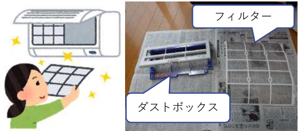
フィルターを取り出します (あればダストボックスも取り出します)