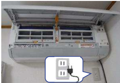
プラグを抜き、カバーを開けます