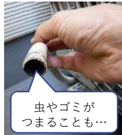
虫やゴミが つまることも…

排水ホースはつまっていませんか？ エアコンからの水漏れの 原因になってしまいます