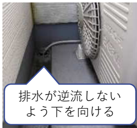
排水が逆流しない よう下を向ける