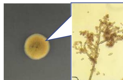
エアコンに多いクロカビ