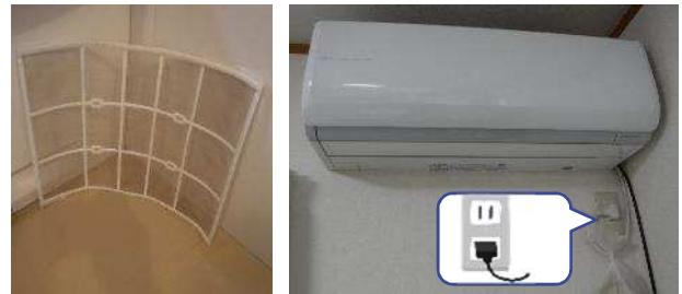
水洗いを行った時は、陰干しなどで しっかり乾かしてからフィルター等を セットし、その後プラグを差します