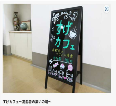
すげカフェ～高齢者の集いの場～