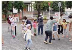
手つなぎ遊びを楽しむ園児と公園体操メンバー