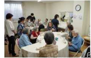
初日の「てくてくカフェ」の様子

花織たま北小規模多機能型居宅介護事業所 4回目について、職員やボランティアの方と一緒に続けていきたいです。