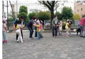
距離感がグッと縮まる大人と子どもがペアになる遊び

予想以上の反応で子どもたちが本当に喜んでくれました。園児等はなかなか自分のおばあちゃんたちに会えない中で、公園のおばあちゃんと会えることをすごく楽しみにしています。また、月1回というペースが継続のしやすさにも繋がっています。また、「お礼の手紙を書きたい」と子どもたちから声が上がったことが印象的でした。デジタルな世の中で、見えない人に思いを馳せながら、手紙を書くという経験、私達保育士にとっても、ものすごくありがたい経験でした。