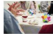
インスタントコーヒーとちよっとしたお菓子だけで会話が弾みます

「てくてくと歩いていける距離にあるカフェ」という思いが込められた名前。開催の日印は入口前に置かれる立て看板