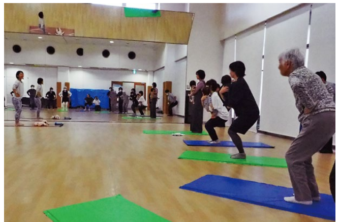
乳幼児を抱くママもシニアも、同じポーズでストレッチ