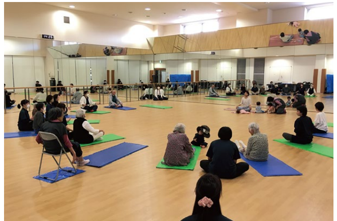
小さな子と一緒にいるだけで自然と笑顔が咲きました