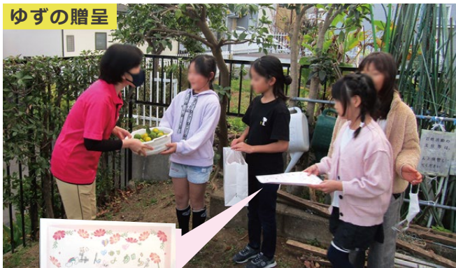
ゆずとお手紙を渡す、南菅こども文化センターの子どもたち