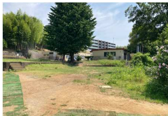
うりぼう保育園側