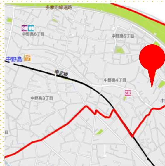
【参考 令和3年度 中野島地区カルテ】