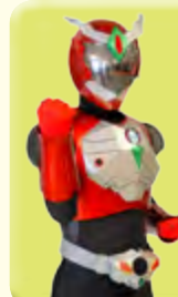
生田地区町会連合会キャラクター：仮面ウォーカーイクター