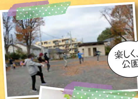
楽しく、元気に 公園体操！

安心して暮らしやすい地域をつくるために、地域で活動をしている方がたくさんいます。この通信では、生田4~8丁目と三田エリアの地域活動の一部を紹介します。 地域活動を通じて、ご近所さんをつなぎ、自分も地域も元気にしていきましょう！