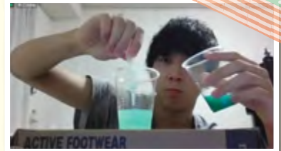
三田子ども文化センターと連携して実施した「子ども科学教室ボランティアプログラム」の様子