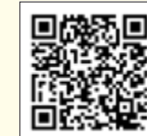
みた・まちもりカフェの予約表はこちらから