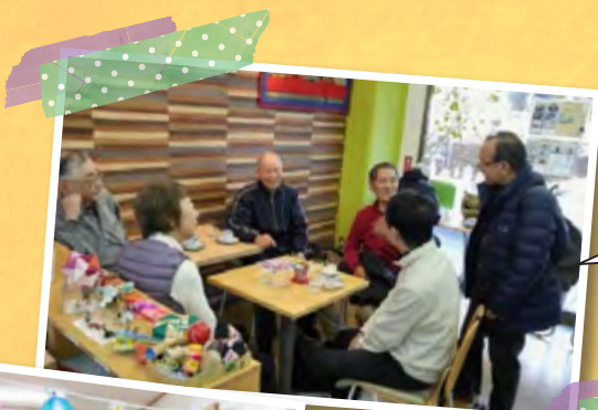
ご近所さんと 交流できる 身近な居場所 地域カフェ