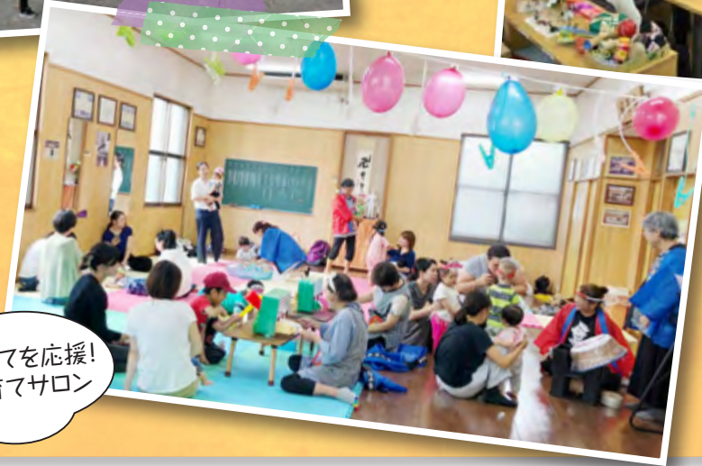
子育てを応援！ 子育てサロン