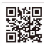
「源氏物語」の和歌について