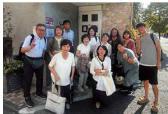
セミナー後はレストランで交流を深めました