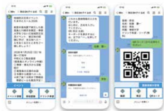
③LINEを用いたイベント参加者情報管理システム