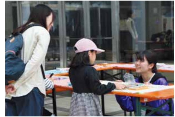
学園祭当日の様子