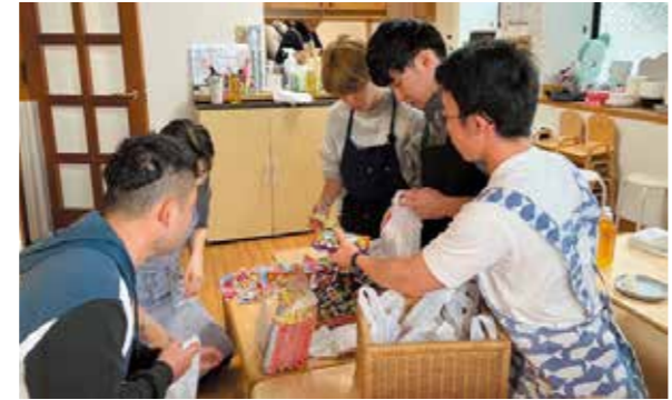
子ども食堂手伝いの様子

地域の方からの依頼による活動だけでなく、自ら企画・実行する活動にも力を入れています。地域の皆様がより快適に過ごせるよう、今後も積極的にボランティアに取り組んでいきます。