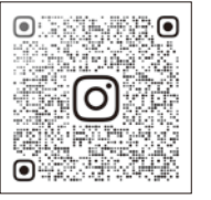
専修大学 まちづくりGDXラボ Instagram

大学生や大学教員が地域をフィールドに研究し、地域住民とともに地域課題解決や地域づくりに継続的に取り組み、地域活性化、地域人材育成等に資する活動。