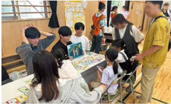
子ども祭り参加の様子

これからも、私たち自身だけでなく、地域の皆さんと一緒に防災意識を高められるように活動を続けていきたいと考えています。