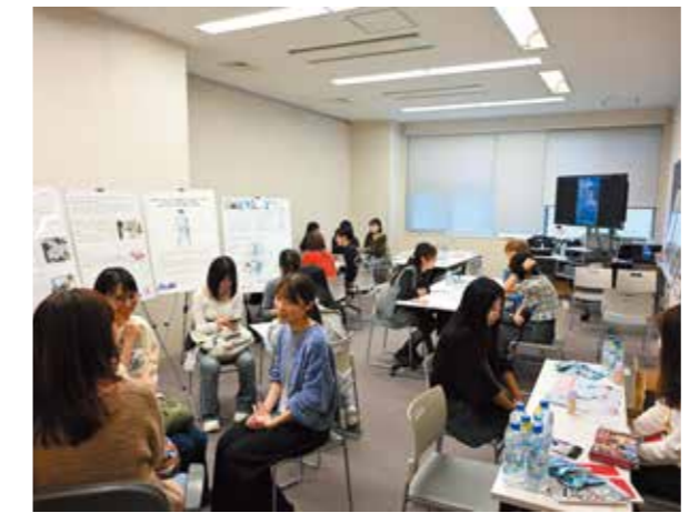
学園祭での活動の様子

大学HPや大学公式SNSで、日本女子大学での学生生活が分かるさまざまな情報を発信しているので、ぜひご覧ください!