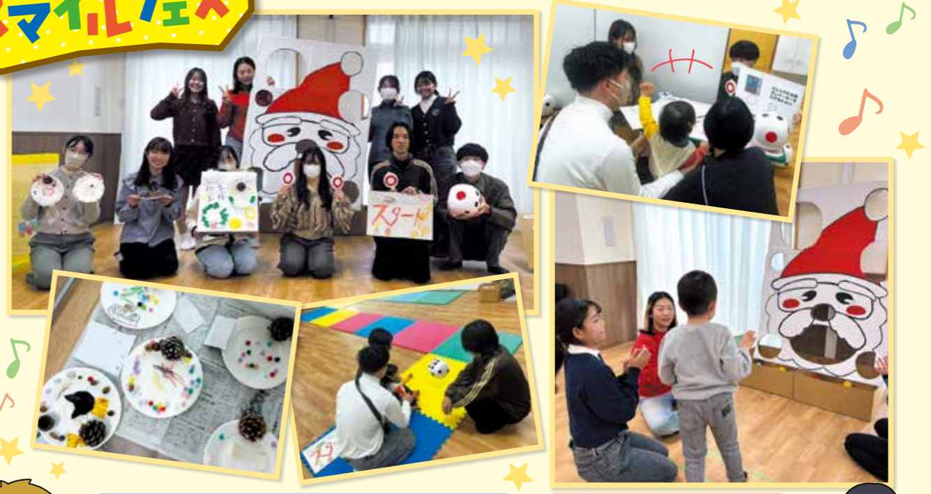
ワークショップやイベントなど、各回でさまざまな世代の人と関わることで、どのように話せば印象が良いかを考えるなど、経験になった。自分にはない考えや意見もあり視野が広がった。

12月6日（土）に参加学生と多摩区保育・子育て総合支援センターが連携して実施しました。各ブース出店のほか、学生はチラシとSNSの2チームに分かれ、イベントの広報にも力を入れました。当日は限られた開催時間の中、80人以上の方にお越しいただきました！