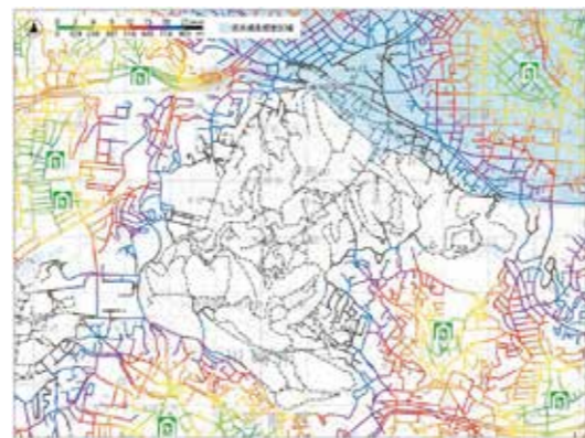
①川崎市多摩区の逃げ地図デジタル版

1月25日(日)には多摩区で防災活動に取り組む方々と能登半島地震・豪雨の被災地をオンラインで繋いだ地域交流イベントを実施しました。