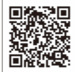
国際交流センターHP