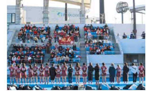
試合後の日本女子大学ラクロス部の様子

令和7年度は惜しくも関東女子ラクロスリーグ戦2部昇格を逃す結果となってしまいましたが、気持ちを新たに2部へ振り返ることを目標に練習に励んでいきます。