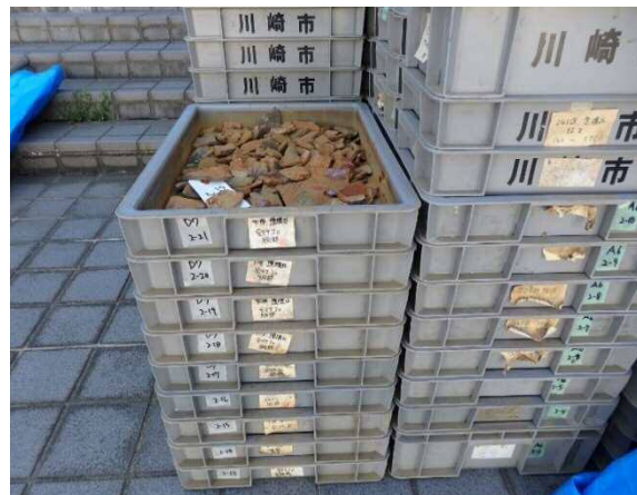
第2収蔵庫から運び出した考古資料