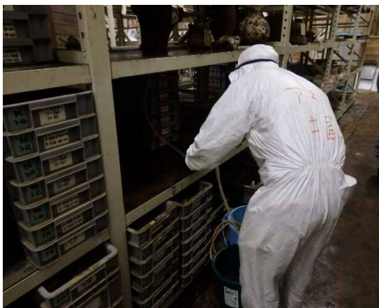
コンテナからの水抜き作業（第2収蔵庫）