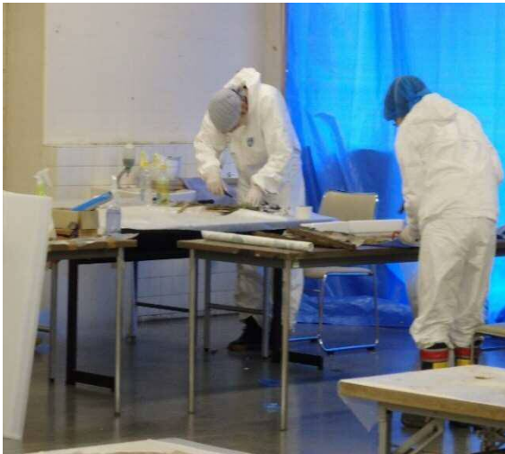
グラフィックのレスキューの様子