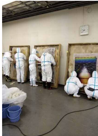
引出しに固着したグラフィックを剥がす様子