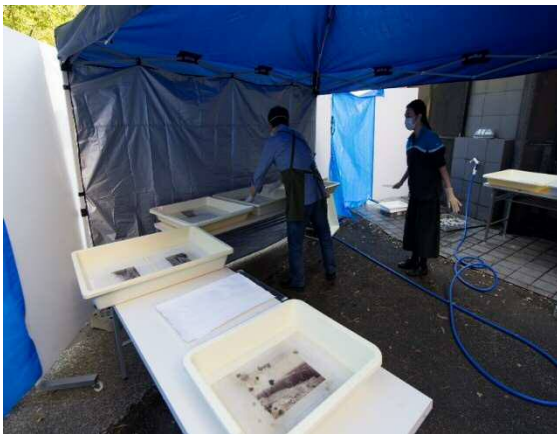
写真のレスキューの様子