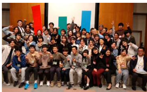
2022年度 ハナサク Presentation （成果発表会）