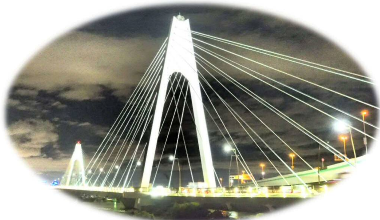
多摩川(上流側)護岸上において、川崎市側から東京都に向けて撮影しております。