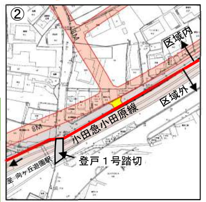
② ■ : 廃止区画道路