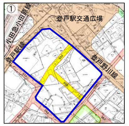
① ■ : 統合する街区 ■ : 廃止区画道路