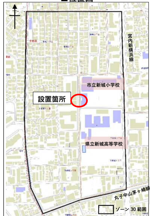
Copyright (C) 2021 ZENRIN CO., LTD. (Z21JF第086号)