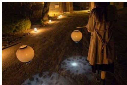
<ディスタンス提灯イメージ>

「KAWASAKI × NAKED, INC. ふるさと結び in 川崎市立日本民家園」の詳細はホームページを御覧ください。