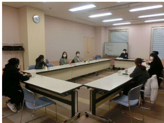
こくさいこみゆにていぶかい 国際コミュニティ部会