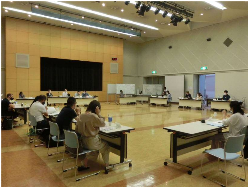
ぜんたいかい ようす 全体会の様子