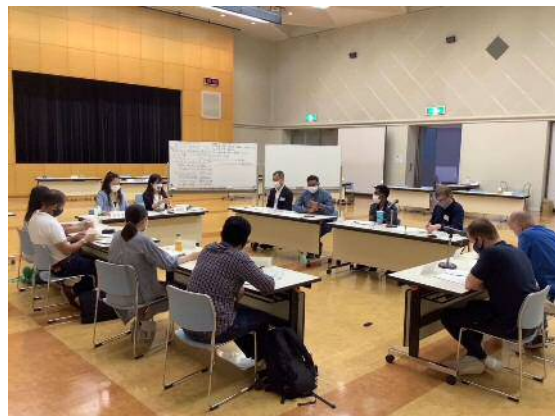
あんしんせいかつぶかい 安心生活部会