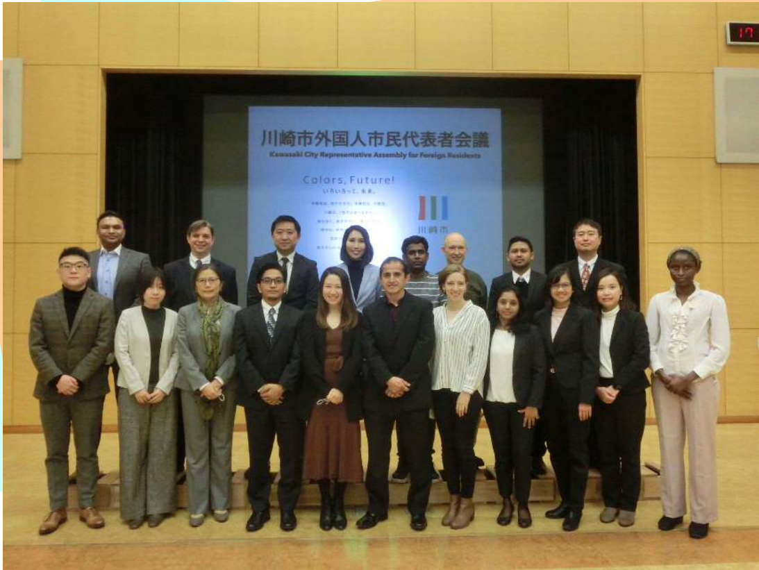
しゃしんさつえいじ ますく はず ※写真撮影時のみ、マスクを外しています

ねん がつむいか にち だい き がいこくじんしみんだいひょうしゃかいぎ ねんどだい かいだいにち しゅうごうしゃしん 2022年2月6日(日) 第13期外国人市民代表者会議2021年度第4回第2日 集合写真