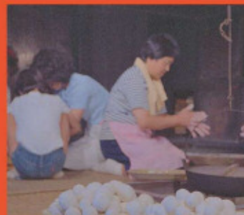
ニュースNo.761 「お月見のだんご作り」川崎市立日本民家園より

神奈川県内の施策と事業をPRするために制作され、県内の映画館で本編上映前に上映された「神奈川ニュース」。中でも川崎市に関連した映像を「川崎市政ニュース映画」といいます。被災後のレスキュー活動でデジタル化を行った映像から、食欲の秋にぴったりなニュースを中心に紹介します。(5作品/計約8分)