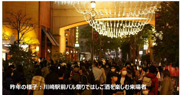
昨年の様子：川崎駅前バル祭りではしご酒を楽しむ来場者