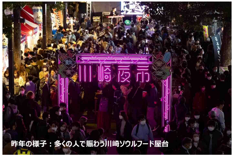
昨年の様子：多くの人で賑わう川崎ソウルフード屋台