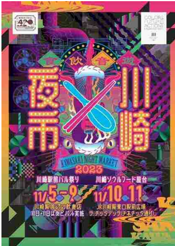
今年度のキービジュアル