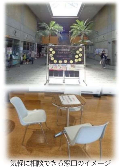
気軽に相談できる窓口のイメージ