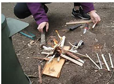
メタルマッチで着火