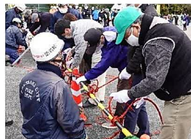
防災ロープワーク （イメージ）