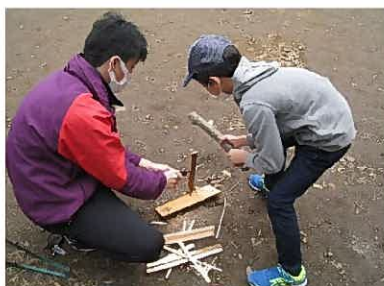
ナイフを使ってまきづくり