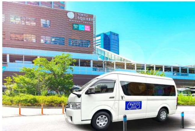
【運行される車両の様子】

双日株式会社（以下「双日」）は、神奈川県川崎市における予約型デマンド交通サービス利用者からの実証実験再開を希望する声を受け、「チョイソコかわさき」事業として2023年5月15日より実証運行を再開します。