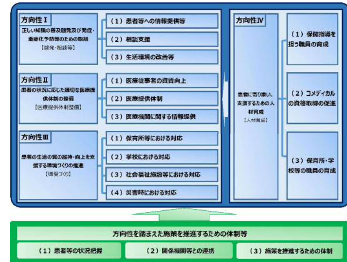
【本市施策の方向性 体系図】

「本市のアレルギー疾患対策の現状」「総合的なアレルギー疾患対策を進める上での視点」、「今後の本市施策の方向性」を整理すると次頁「本市のアレルギー疾患対策の現状と今後の方向性」のとおりとなります。