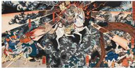
芳員 「新田義興の霊怒て誓を報ふ図」(前期)