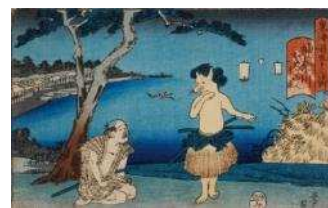
歌川国芳「東海道五十三次内 神奈川」