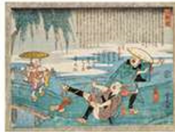
芳幾 「東海道中栗毛弥次馬池鯉鮒」(後期)