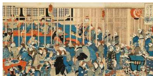
歌川国芳「里すゞめねぐらの仮宿」