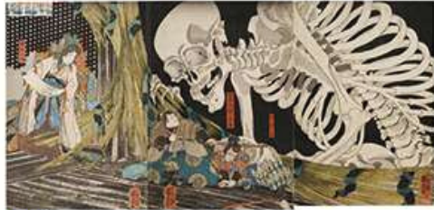
国芳 「相馬の内裏」(後期)

本展ではそんな国芳の代表作とともに、門下で双璧をなすライバル、落合芳幾と月岡芳年の作品を一挙公開し画風の継承に迫ります。さらに、芳艶、芳員、芳虎など「芳」の字を受け継いだ門人たちの傑作も多数出展。国芳一門の迫力あふれる競演を、ぜひお楽しみください。