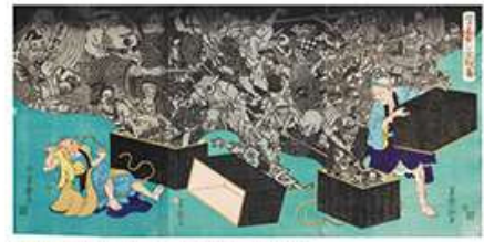
芳盛 「昔ばなし舌切雀」(後期)