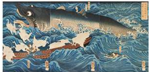
国芳 「讃岐院普賢をして為朝をすくふ図」(前期)