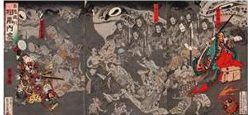
芳幾 「百鬼夜行 相馬内裏」(後期)