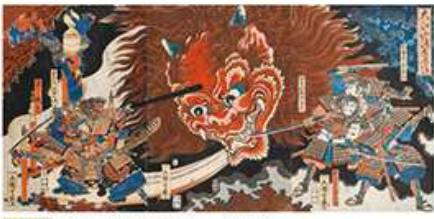
芳艶 「大江山酒呑退治」(後期)