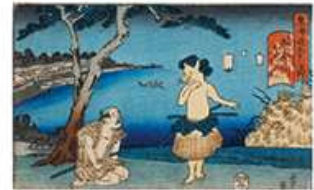
芳員 「東海道五十三次内 神奈川」(前期)