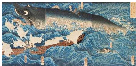
歌川国芳「讃岐院眷属をして為朝をすくふ図」