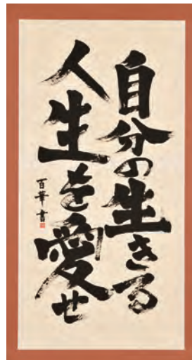
コミュゼ川崎大賞 書作品 《自分の生きる人生を愛せ》 谷口 百華