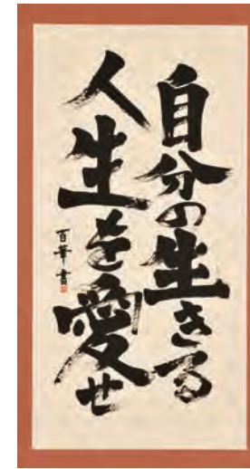
コミュゼ川崎大賞 書作品 《自分の生きる人生を愛せ》 谷口 百華