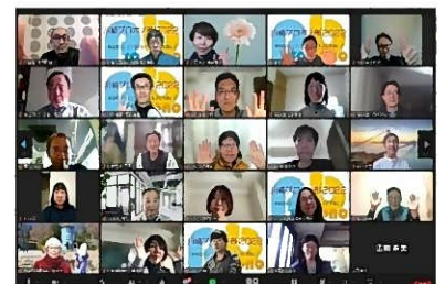
オンラインによる打合せ

※プロジェクト実施にあたっては、Zoom等のウェブ会議ツールによるオンラインのやり取りが基本となります。 ※応募方法、会場等の詳細は別添チラシを御覧ください。