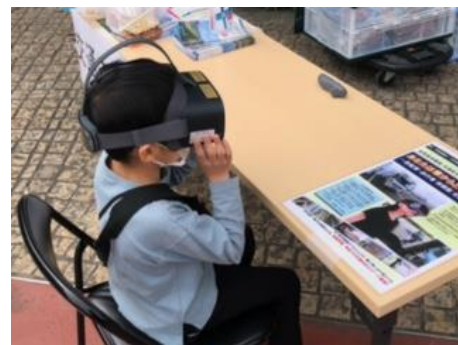
交通安全 VR を使って、 道路上の危険を疑似体験！