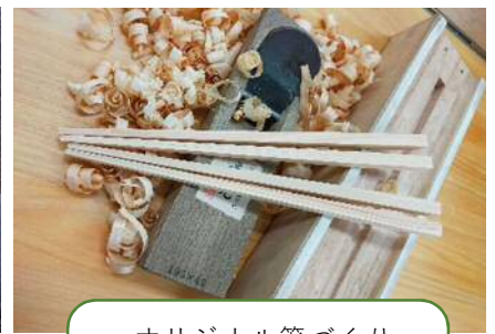
オリジナル箸づくり