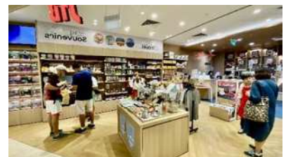
（参考）令和 4 年度に実施したシンガポールでのテストマーケティングイベント

※実施予定国のイギリスは、小売り全体に占める EC の割合が世界第 2 位で市場規模が大きく、シンガポールは、東南アジア地域のハブであり訪日客のリピート率が高いことで知られています。