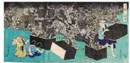
芳幾 「昔ばなし舌切雀」(後期)