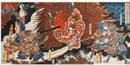
芳艶 「大江山渡西遊浴」(後期)