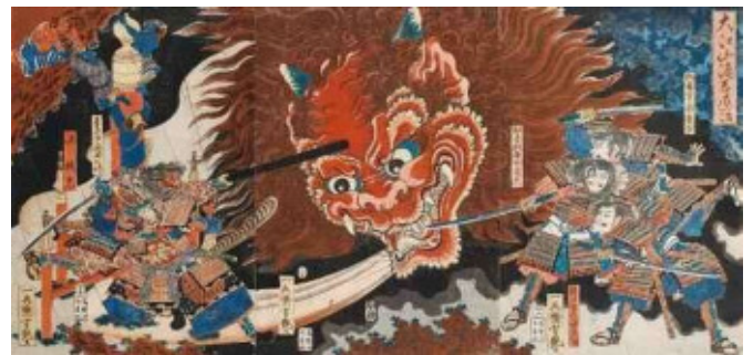
うたがわよしつや おおえやましゅてんたいじ 歌川芳艶「大江山酒呑退治」