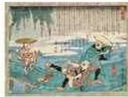
芳幾 「東海道中栗毛弥次馬池鯉屋」(後期)