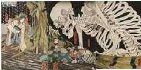
国芳 「相馬の古内裏」(後期)

本展ではそんな国芳の代表作とともに、門下で双璧をなすライバル、落合芳幾と月岡芳年の作品を一挙公開し画風の継承に迫ります。さらに、芳艶、芳員、芳虎など「芳」の字を受け継いだ門人たちの傑作も多数出展。国芳一門の迫力あふれる競演を、ぜひお楽しみください。