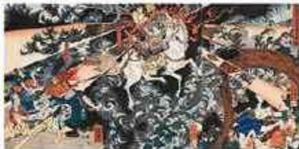
芳員 「新田義興の霊感て賢を報ふ図」(前期)