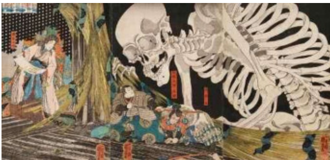
うたがわくによし そうま ふるだいら 歌川国芳「相馬の古内裏」