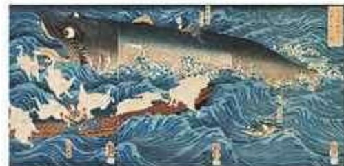
国芳 「讀妓院書画をして為朝をすくふ図」(前期)