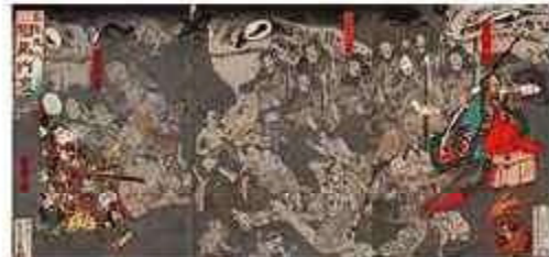
芳幾 「百鬼夜行 相馬内裏」(後期)