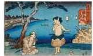
芳員 「東海道五十三次内 神奈川」(前期)