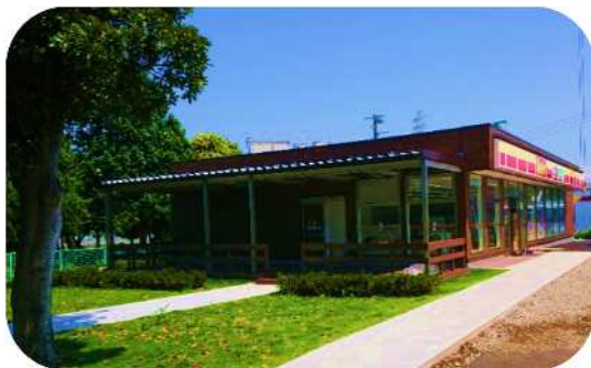
公募対象公園施設(コンビニエンスストア)