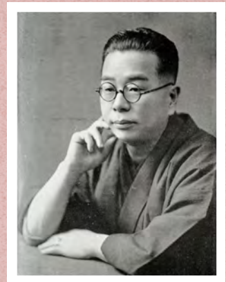
佐藤惣之助肖像写真

「赤城の子守唄」「六甲おろし」などの作詞家として広く知られる佐藤惣之助は、明治23(1890)年に現在の川崎信用金庫本店付近にあった川崎宿本陣の家に生まれました。大正4(1915)年に初めての詩集を出版し、以降、詩集17冊、随筆集12冊、ほか釣りに関する著作集7冊、発句集2冊を残しています。本講座では、文学活動のほかにも、釣りや旅を愛し、沖縄、南洋、オホーツクを巡り、飛行機にもいち早く乗り込んだ惣之助の人物像に触れながら、その足跡をたどります。