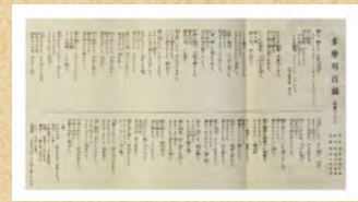
多摩川音頭パンフレット(裏面・部分)

7月28日(金)よりオンライン展覧会を同時開催！市民ミュージアムのWebサイトにてご覧いただけます。