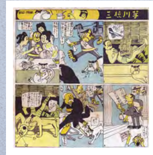
日本初のアニメーションの原作になったと考えられる漫画「芋川椋三」(『東京パック』大正4(1915)年)

日本で最初のアニメーション映画は大正6(1917)年1月に、浅草の映画館で公開されました。作ったのは天然色活動写真株式会社(現東宝)に雇われた漫画家の下川凹天(へくてん)という人物。これを皮切りに他社もアニメ制作に参入、競うように作品が作られ、日本のアニメ産業は黎明を迎えます。しかし、この時作られた作品はほとんど現存していません。はたして100年以上昔に作られたアニメはどのような作品だったのか、知られざる日本の初期アニメーションの全貌に迫ります。