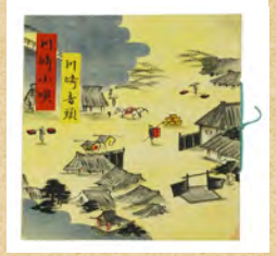
川崎音頭・川崎小唄パンフレット