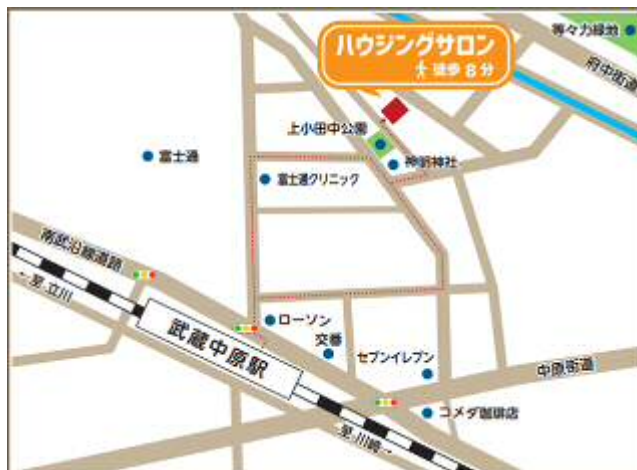
移転後のハウジングサロンの案内図

※令和5年9月30日(土)はセミナー開催のためお休み、10月1日(日)・2日(月)は定休日。