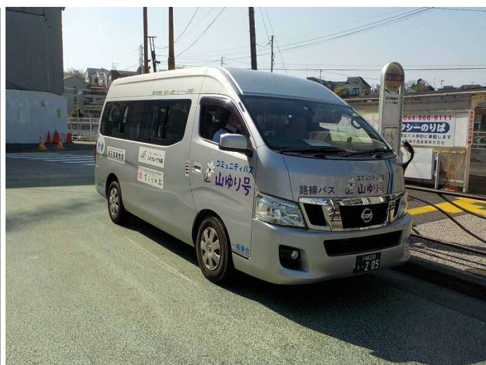
図 山ゆり号運行車両