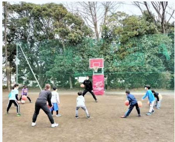
真剣にバスケットボールを教わる参加者 （昨年度のバスケットボール教室の様子）