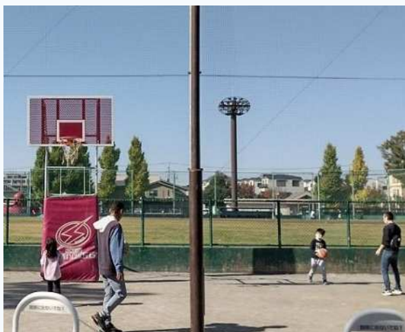
親子で楽しむバスケットボール （平日の利用状況）