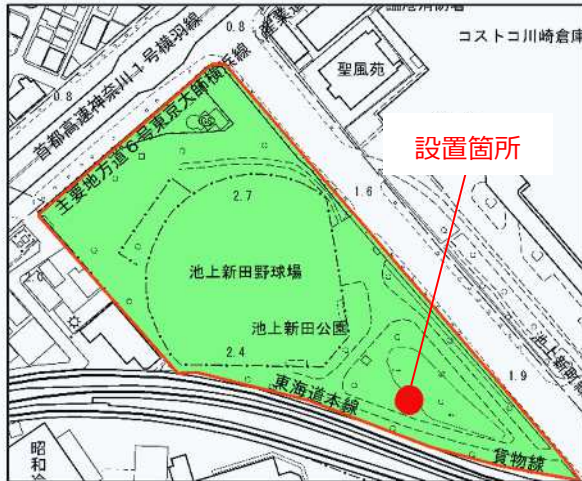
池上新田公園（川崎区）