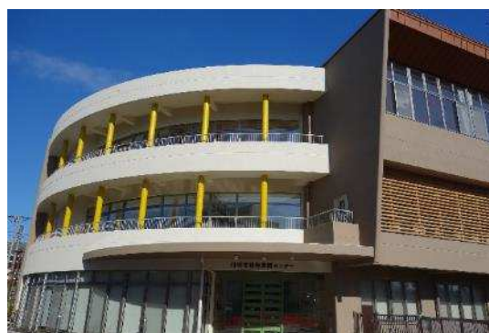
動物愛護センター (ANIMAMALL かわさき)