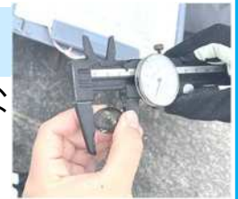
アサリの計測もするよ