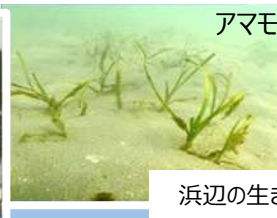
浜辺の生きものとのふれあい