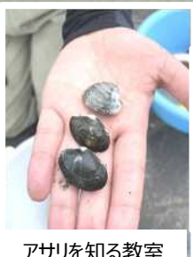
アサリを知る教室