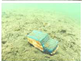
海底で見つかったおもちゃ