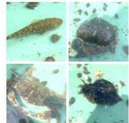
浜辺の生きものとのふれあい