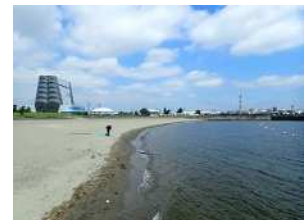
市内唯一の人工海浜で環境学習