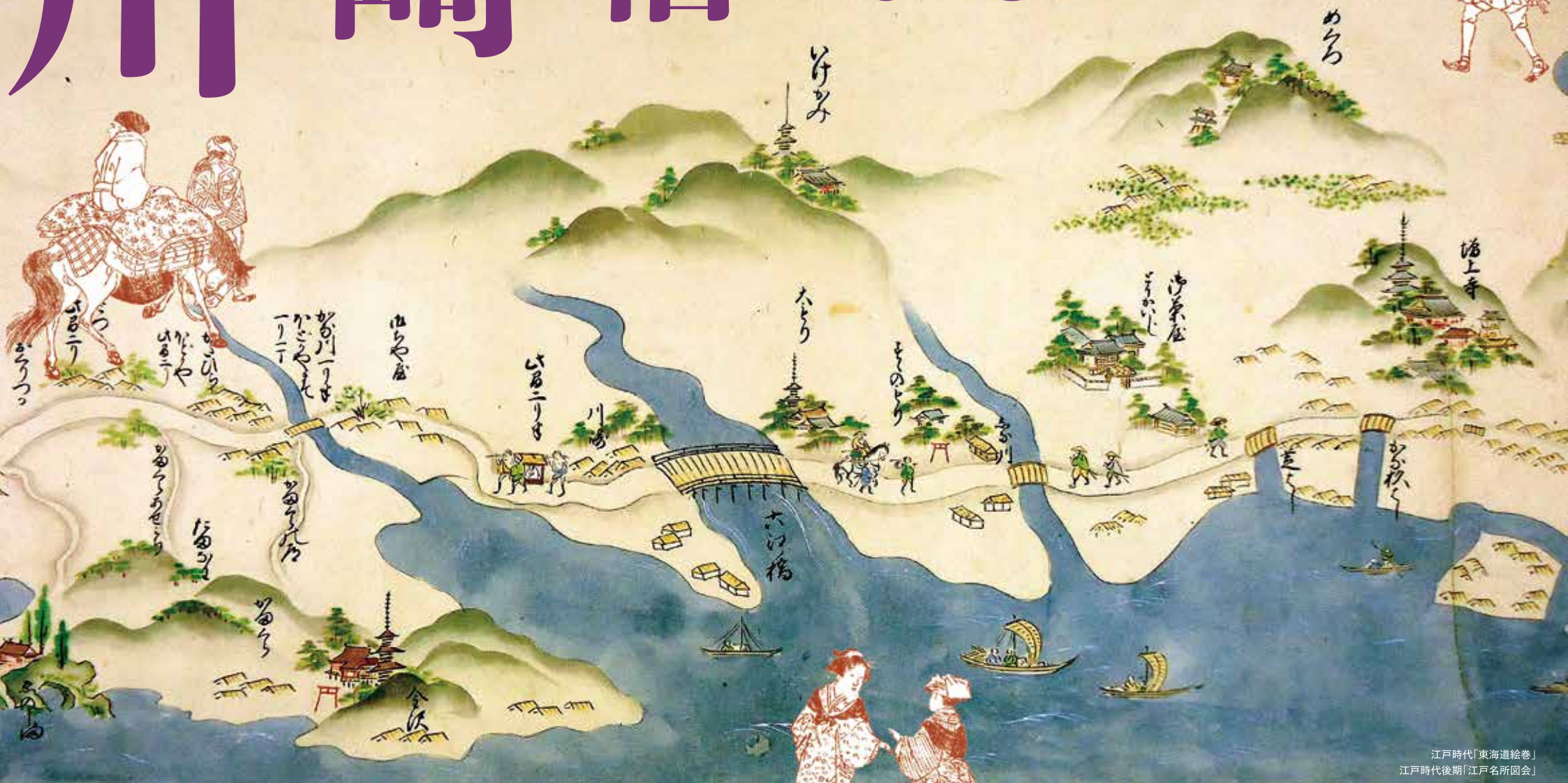
江戸時代「東海道絵巻」 江戸時代後期「江戸名所図会」