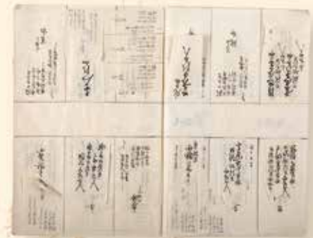
こんばんごじょうらくにつきかきあげしゆくず 文久3年「今般御上洛二付書上宿図」

申込・問い合わせ先 〒211-0051 川崎市中原区宮内4-1-1 川崎市公文書館(TEL: 044-733-3933)