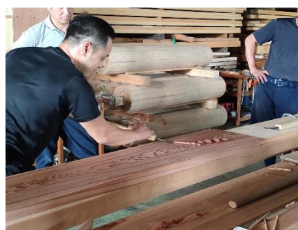
ヤリガンナ仕上げ