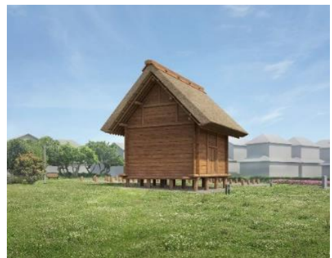
倉庫復元イメージ