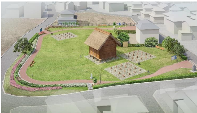
歴史公園完成イメージ