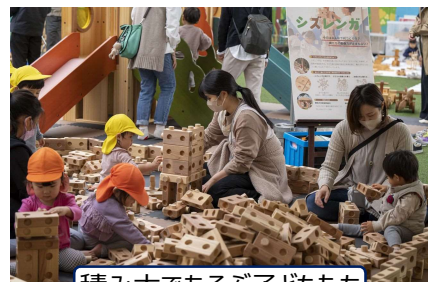
積み木であそぶ子どもたち