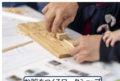
お箸をつくるワークショップ