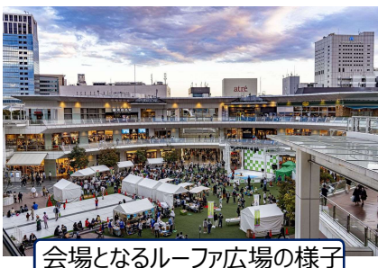
会場となるルーファ広場の様子