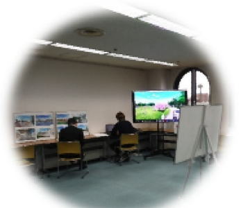
パネル展示のイメージ