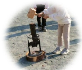
薪割体験のイメージ