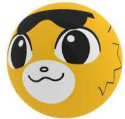
アドバルーンデザイン