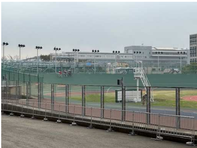
透明なポリカーボネート製のフェンス