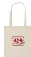
▲江戸楽抜き刷りとトートバッグ