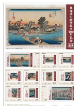
▲川崎宿起立400年記念切手