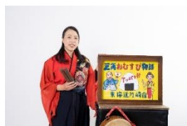
▲紙しばいや もっちい