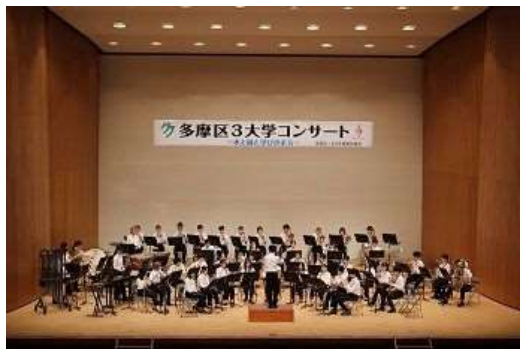
明治大学 Wind Orchestra

川崎市多摩区役所企画課 相原 （多摩区・3大学連携協議会事務局） 電話：044(935)3144 FAX：044(935)3391