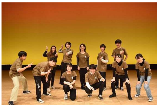
専修大学 混声合唱団カップコーラス部